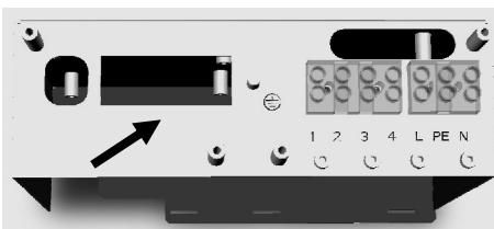
Programmierschnittstelle im Elektroanschlussraum

Stecken Sie das Netzteil des Lerngerätes an eine Steckdose an (evtl. Verlängerungskabel benutzen). Spielen Sie das Software-Update auf das Lüftungsgerät auf, indem Sie den Stecker des Lerngerätes an die dafür vorgesehene Schnittstelle im Elektroanschlussraum anstecken und nach dem zweimaligen Aufleuchten der drei LED's auf „Programmieren“ drücken. Während des Programmiervorgangs leuchtet die grüne LED. Ist die Programmierung erfolgreich abgeschlossen, dann leuchtet die gelbe LED. Ist die Programmierung fehlgeschlagen, dann leuchtet die rote LED. Wiederholen Sie in diesem Fall den Programmiervorgang.